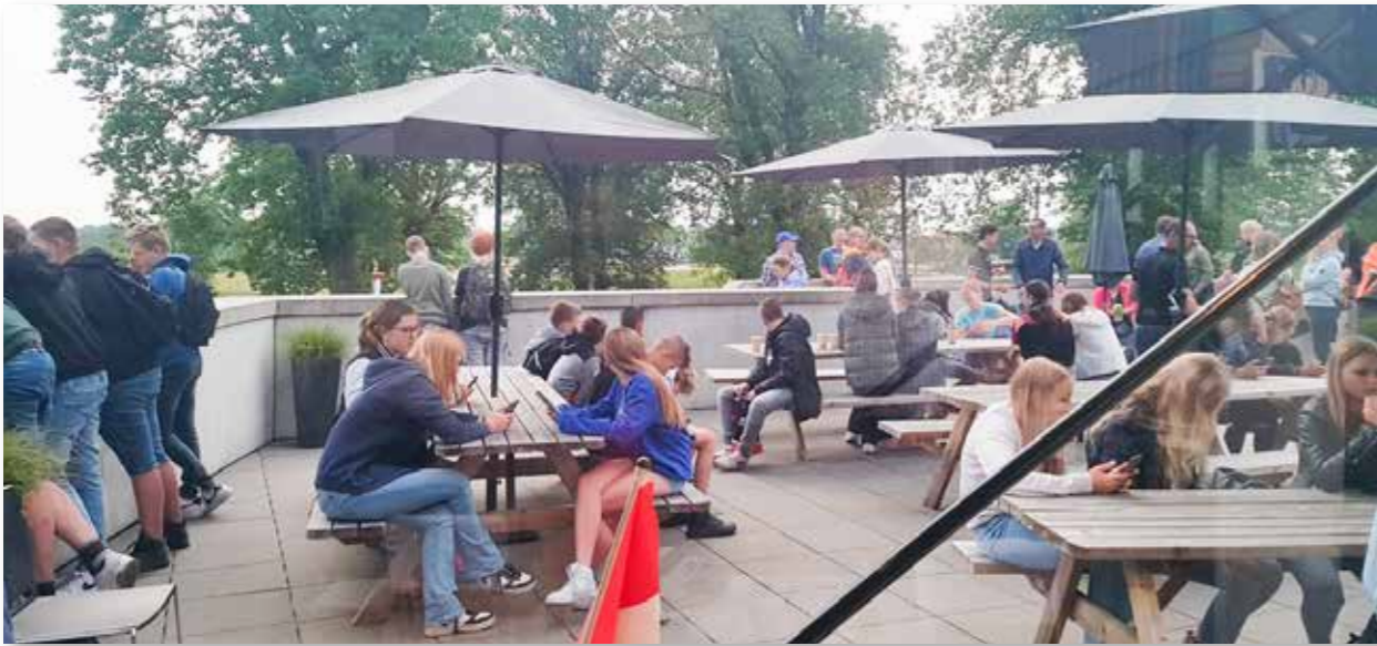
Juni 2023: de Meerwaarde uit Barneveld meldde zich met 320 leerlingen. Het dakterras met picknickbanken en parasols vormde een passende en praktische wissel- en rustlocatie.

Samen kwamen bijna 900 leerlingen voor een rondleiding en/of een bezoek aan de expositie. In samenwerking met de scholen werd een breder aanbod verzorgd waarbij ook aandacht was voor biologie, aardrijkskunde en sport. Het terrein van het Fort aan de Buursteeg leent zich hier uitstekend voor. De scholen kwamen in 2023 uit Veenendaal, Ede, Barneveld, Arnhem, Kesteren, en Zeist. Opvallend is het grote aantal leerlingen uit de provincie Gelderland, wat nogmaals het belang van het centrum voor beide provincies accentueert.