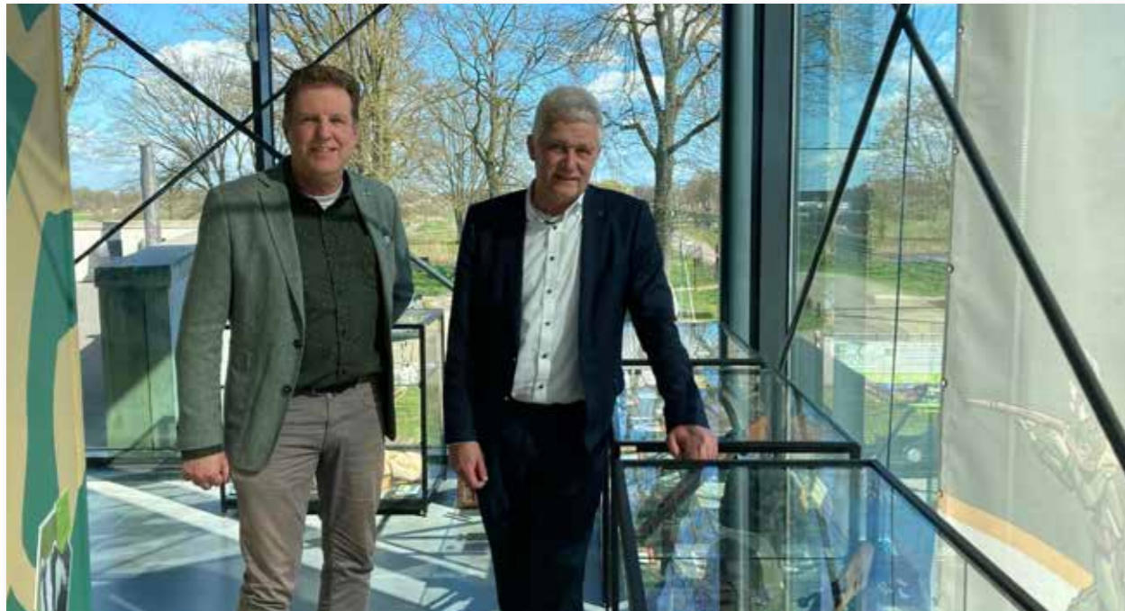
Mei 2023: Wethouder Van der Schoor (rechts) op bezoek om de nieuwe vitrine te bewonderen die door een subsidie van de gemeente Renswoude mede mogelijk werd gemaakt.

De introductiefilm in de filmzaal is in 2023 voorzien van Nederlandse en Engelse ondertitels, zodat slechthorenden en buitenlandse toeristen het verhaal beter kunnen volgen. Om de leesbaarheid voor alle bezoekers te vergroten zijn nieuwe paneeltjes geplaatst bij alle objecten in de expositie. Voor een deel zijn tevens Engelse bijschriften gemaakt. Door de objectenbeheerder zijn alle objecten in een overzichtelijk systeem ingevoerd.