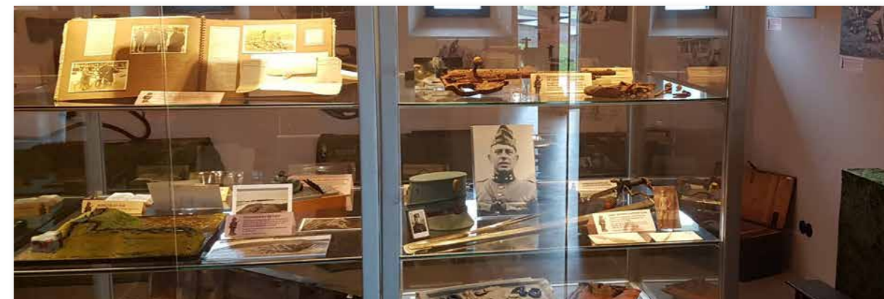
Mei 2023: Vitruines met voorwerpen en fotoalbums over de Grebbelinie in Veenendaal. De tentoonstelling werd in regionale kranten vermeld en trok veel publiek. Het verzamelen en delen van verhalen vormt een belangrijke levensader voor het centrum.

De expositie werd door duizenden bezoekers bezocht en fungeerde tevens als uitnodiging voor families van voormalige militairen. Sinds de ingebruikneming van de wisselexpositie ontvangt het centrum met grote regelmaat materiaal en verhalen van de bezoekers over familieleden die gediend hebben in de Grebbelinie.