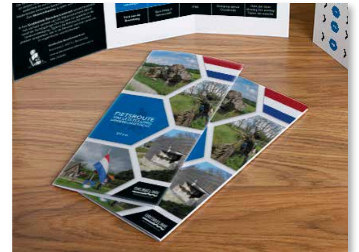
De route 'Vallestelling' verbindt het Grebbelinie Bezoekerscentrum in Renswoude met het Educatief Centrum in Woudenberg. Ook de museumbunker in Leusden is opgenomen in de fietstocht.

Het Fort aan de Buursteeg is een uitgelezen plek voor living history. Hierdoor krijgen de bezoekers meer inzicht in de betekenis van de aarden wallen en het dagelijks (militaire) leven in het fort. De kleine evenementjes gebeuren met gesloten beurs en dienen geen (direct) commercieel doel.