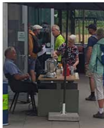
Juli 2023: Deelnemers komen stempelen en koffie halen bij het bezoekerscentrum tijdens de Grebbelinie Wandeltocht.

De wandelkaart over het Fort aan de Buursteeg die eerder al in het Nederlands (2017), Duits (2021) en Frans (2022) verscheen, werd in 2023 vertaald naar het Engels en Spaans.