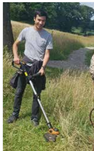
Hoewel een belangrijk deel van de vrijwilligers gepensioneerd is, sluiten zich van tijd tot tijd ook jongere medewerkers aan, bijvoorbeeld voor groenbeheer.

Het aantal vrijwilligers steeg van 25 naar 35. Daardoor kreeg het centrum meer ruimte voor aanvullende activiteiten. Vrijwel alle vrijwilligers bleven in het centrum, waardoor de groep meer ervaren werd en men de bezoekers nog beter kon helpen op recreatief en historisch gebied.