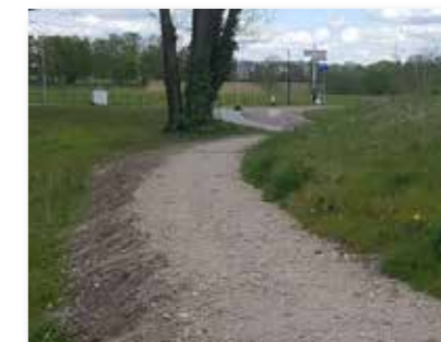
April 2023: Het paadje vormt een comfortabele verbinding tussen parkeerplaats (TOP) en centrum.

Dankzij maatregelen in 2022 (o.a. bebording) en toezicht/handhaving in 2023 was er van parkeerproblematiek geen sprake meer. Het wandelpad van station Veenendaal-De Klomp naar het bezoekerscentrum werd door de gemeente Ede verbeterd.