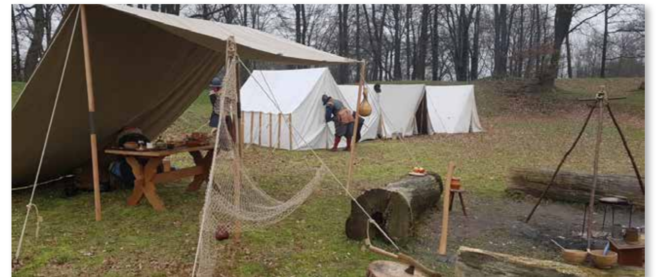
Januari 2023: Ondanks de kou arriveren de eerste re-enactors van 2023 op het fort.

Wel betekenen de bezoeken een welkome vorm van promotie. Na corona werden contacten aangeknoopt met groepen die zich bezighouden met de Tweede Wereldoorlog. In 2023 werd de groep living history versterkt met 'De Spiesdraegers', die met enige regelmaat bivakkeren op het fort. Hierdoor krijgt ook de vroegste periode van de Grebbelinie (16 en 17e eeuw) de aandacht die het verdient. De ervaringen waren van dien aard dat de groep vaker zal terugkeren op het terrein.